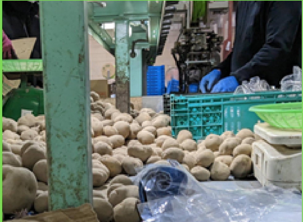
ジョブジック環状通り東